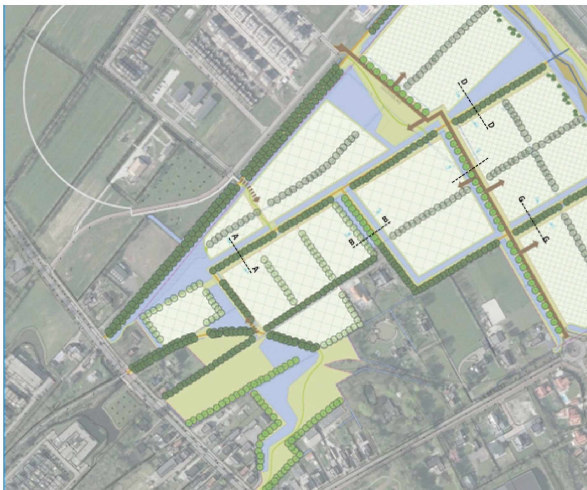
Basisstructuur Vrijburgh III uit 'ruimtelijk kader Vrijburgh 2 en 3'.

Eerste aanzet tot een kaderdocument maart 2022