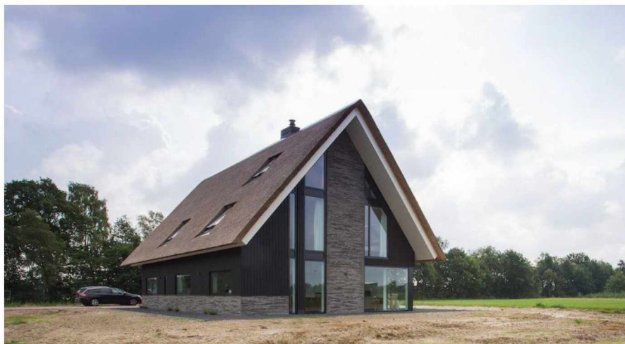
Referentiebeelden G32b. Eigentijds landelijk wonen aan de natuurlijke geluidswalzone (deelgebied b)