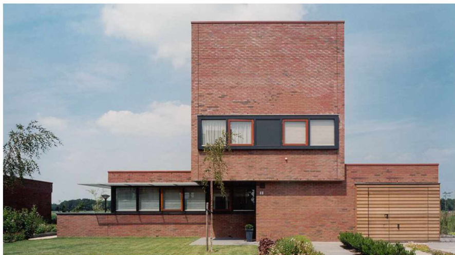
Referentiebeelden G32a. Eigentijds landelijk kubistisch wonen aan de Folgeralaan (deelgebied a)