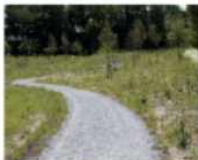
Informele paden in tuinverharding