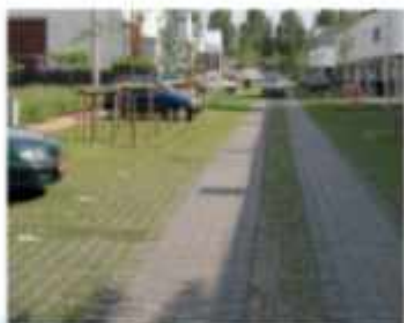
Ontsluitingsweg vormgevers als informeel pad of plekje