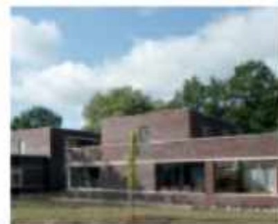
Voorbeeld ontwerp plantsoening passend bij de omgeving