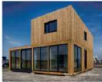
Woning met sterke relatie met de omgeving