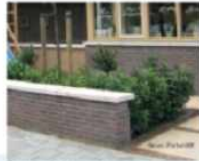
Erfelijkheid en vormgeving een ontwerp in architectuur of door middel van hegen.