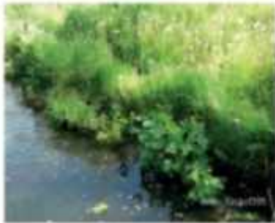
Water met natuurlijke oevers