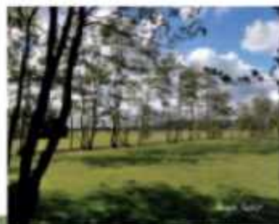
Plantingen in woonwijken